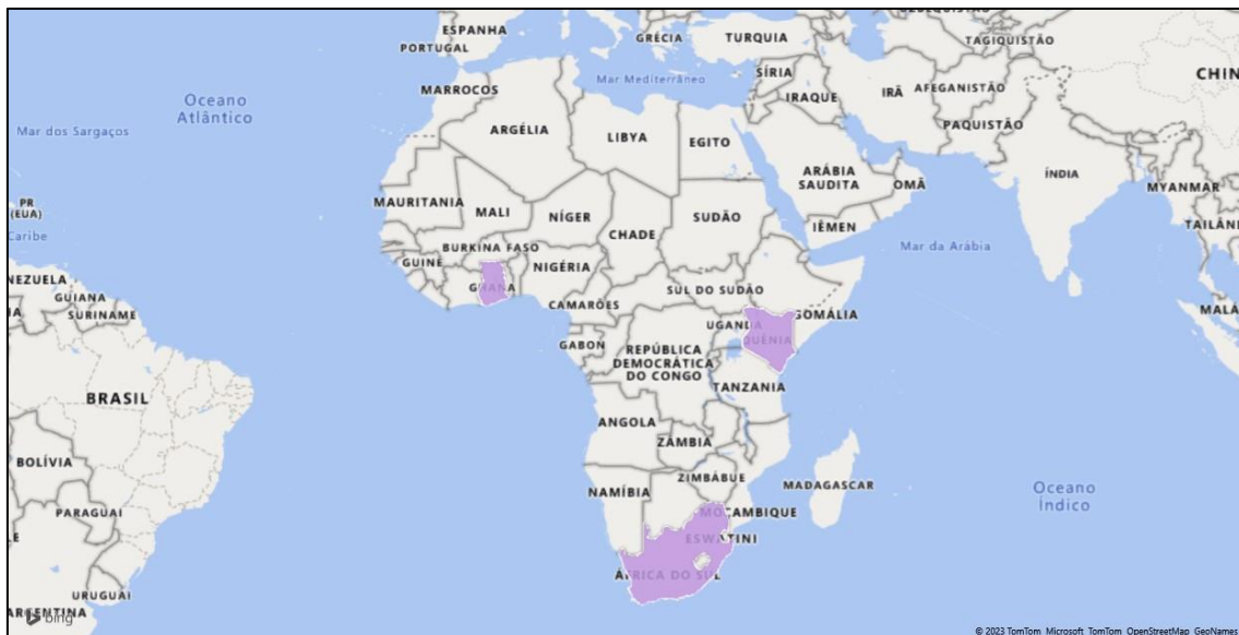
Figura 1. Mapa do continente africano com destaque para África do Sul, Gana e Quênia