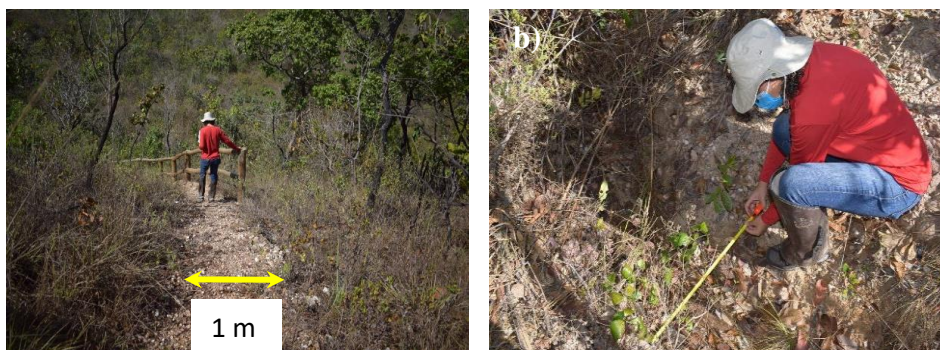
Figura 4. (a): Percurso da trilha apresentado a largura de 1 m. (b): Medindo ravina durante o percurso da trilha do rio Traíras.

Sendo considerado um tempo estimado para percorrê-la de 1 hora, é de fácil acessibilidade [pouco severa, exige a identificação de acidentes geográficos e de pontos cardeais, percurso por trilhas escalonadas, e exige pouco esforço físico] dessa forma, iniciantes podem executá-las tranquilamente. Foi estimado um perímetro de largura de 1 metro, sendo aceitável 1 pessoa/metro [Fig. 4 a ]. Durante o percurso foram observados três pontos de erosão de origem natural [ravinas], todas foram medidas com relação a largura, comprimento e profundidade [Fig. 4 b ], além disso, foram observadas diversificadas fitofisionomias do cerrado [Cerradão, Cerrado s. stricto, campo cerrado e campo sujo], além da mata de galeria e mata ciliar.