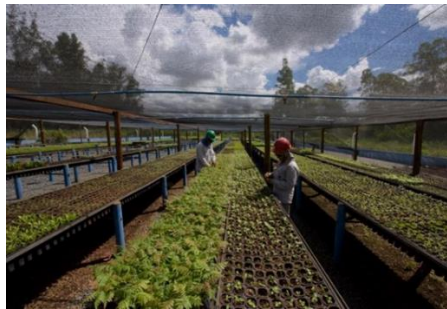
Figura 1. Viveiro de mudas nativas Reserva Particular de desenvolvimento Sustentável Legado Verdes do Cerrado

realizada na reserva, que conta com uma sùtil infraestrutura para acomodar os pesquisadores de diversos lugares do Brasil dentro da RPDS Legado Verdes do Cerrado. Ainda dentro dos conjuntos de proposta, foram implementadas as atividades convencionais relacionadas à agricultura; produção de mel em larga escala; o cultivo de soja transgênica, com média de 55 sacas por hectare no ano de 2018, e de milho safrinha com média de 80 sacas por hectare (Idem).