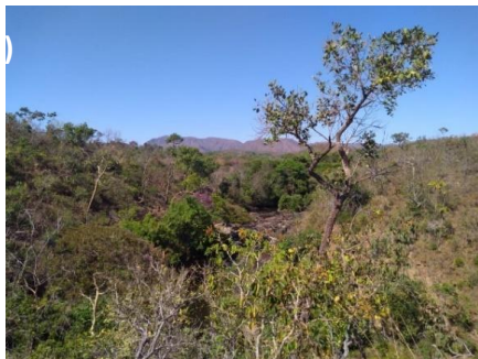
Figura 2. (a) Mirante no percurso da Trilha do Traíras na reserva Legado Verdes do Cerrado. (b) Estrada da Trilha do Traíra

Essas atividades vem sendo implementadas com a finalidade de atender à demanda socioeconômica local, pois o município de Niquelândia há 40 anos tinha a sua economia voltada para a extrativismo mineral, com uma compensação financeira pela exploração de recursos minerais [CFEM] em torno R$1.222.763,01 no ano de 2015 [ANM, 2015], contudo, nos últimos quatro anos o município teve o fechamento de uma das maiores mineradoras da cidade, levando ao declínio econômico, com metade do comércio, bens e serviços em funcionamento. Como mencionado, devido ao grande potencial da biodiversidade da RPDS Legado Verdes do Cerrado (Fig. 2a), uma das ações propostas implementada ainda em desenvolvimento é a atividade do ecoturismo.