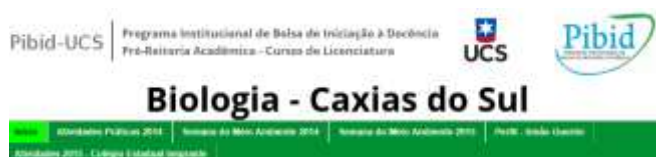
Figura 6. Blog do PIBID - Biologia/UCS (Caxias do Sul).

Todas as atividades desenvolvidas pelo PIBID - Biologia/UCS podem ser conhecidas de forma detalhada diretamente no Blog na página institucional da Universidade de Caxias do Sul ( http://pibid-ucs-biologia-cxs.blogspot.com.br/ ).