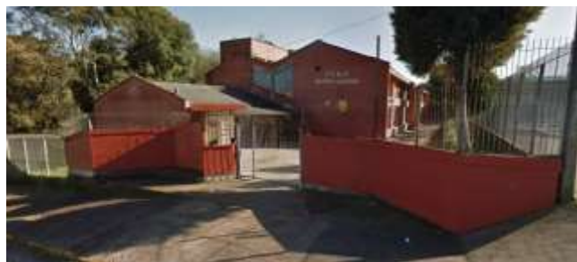
Figura 2. Escola Estadual de Ensino Médio Irmão Guerini.

O PIBID - Biologia da Universidade de Caxias do Sul (UCS) buscou a integração com a realidade da Escola Estadual de Ensino Médio Irmão Guerini (Figura 2) e do Colégio Estadual Imigrante (Figura 3) (Caxias do Sul - RS/Brasil) interagindo, analisando, sugerindo estratégias de ensino e alternativas para obter uma maior qualidade e eficiência no ensino de Biologia, com ênfase em uma aprendizagem significativa.