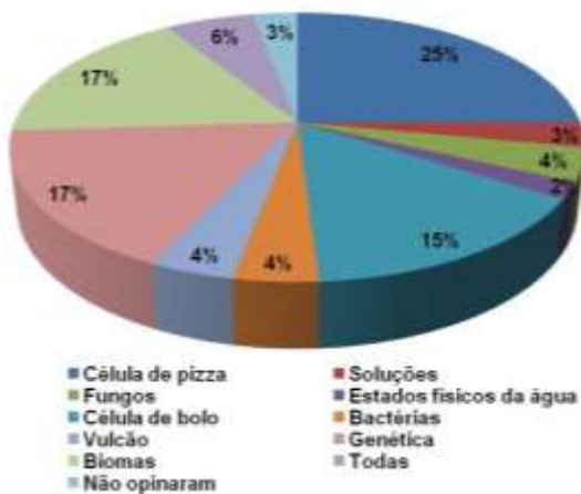
Figura 4. Avaliação do interesse do aluno com relação à atividade prática realizada pelo PIBID.

A partir de uma análise individualizada das atividades práticas desenvolvidas foi constatado que a disciplina de Biologia se apresentou mais atraente aos discentes em todas as séries atendidas pelo programa.