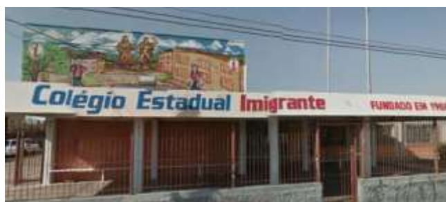
Figura 3. Colégio Estadual Imigrante.

A atuação do programa foi importante no apoio ao desenvolvimento de uma participação mais efetiva dos alunos