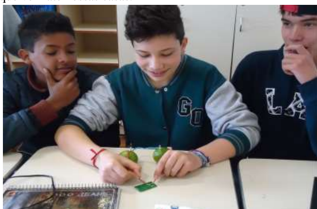
Figura 3: alunos realizando experimentos simples sobre corrente elétrica.

Na área das ciências da natureza foram trabalhados os tipos de energia e corrente elétrica, por meio de experimentos simples com materiais do cotidiano (Figura 3). Organizados em grupos, os alunos buscaram informações na internet ou livros e montaram apresentações de slides para explicar a colegas das outras turmas como é gerada a energia Elétrica que vem até nossas casas.