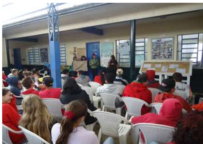
Figura 6: alunos do 9º ano palestrando para todos os alunos da escola.

A área de linguagens também interagiu com as demais áreas ao corrigir e orientar as apresentações que os alunos fizeram para colegas de outras turmas (Figura 6), bem como elaboração de slides, cartazes e textos.