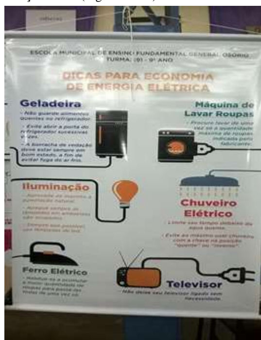
Figura 1: Banner sobre economia de energia.

Os trabalhos desenvolvidos pelos grupos de alunos trataram de produção e consumo consciente de energia. Eles foram expostos no pátio coberto da escola, em aramados e mesas, incluindo diversos materiais como: cartazes, banners, redações, maquetes, gráficos de consumo de energia, além de apresentações orais (Figuras 1 e 2).