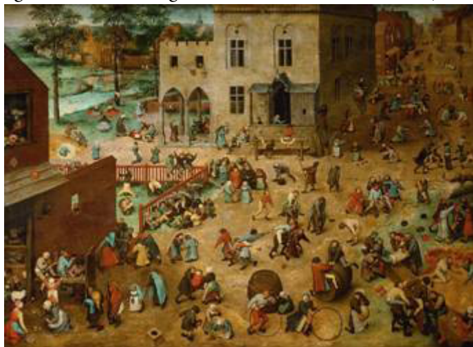
Figura 1: Pieter Bruegel the Elder Children's Games (1560)