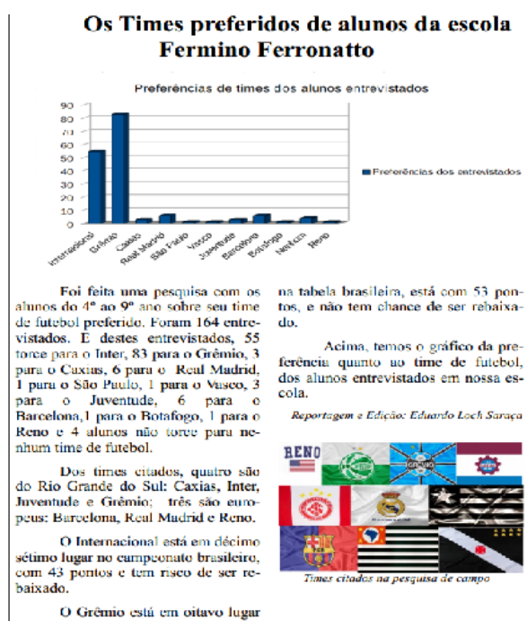
Fig. 3: Times de Futebol.

Os encontros para a produção do jornal aconteceram no LIE, semanalmente, no contraturno do período de estudos dos alunos. Dependendo da demanda, chegou-se a realizar dois encontros por semana. A produção e diagramação do jornal foram feitas utilizando-se materiais e softwares disponíveis no LIE, compatíveis com o sistema operacional, Linux 3.0 (editor LibreOffice e BrOffice, editor de planilha eletrônica Impress, programa de pintura Kolourpaint, programa de captura de tela, recursos multimídia para audição das entrevistas gravadas e para visualização de vídeos, etc.).