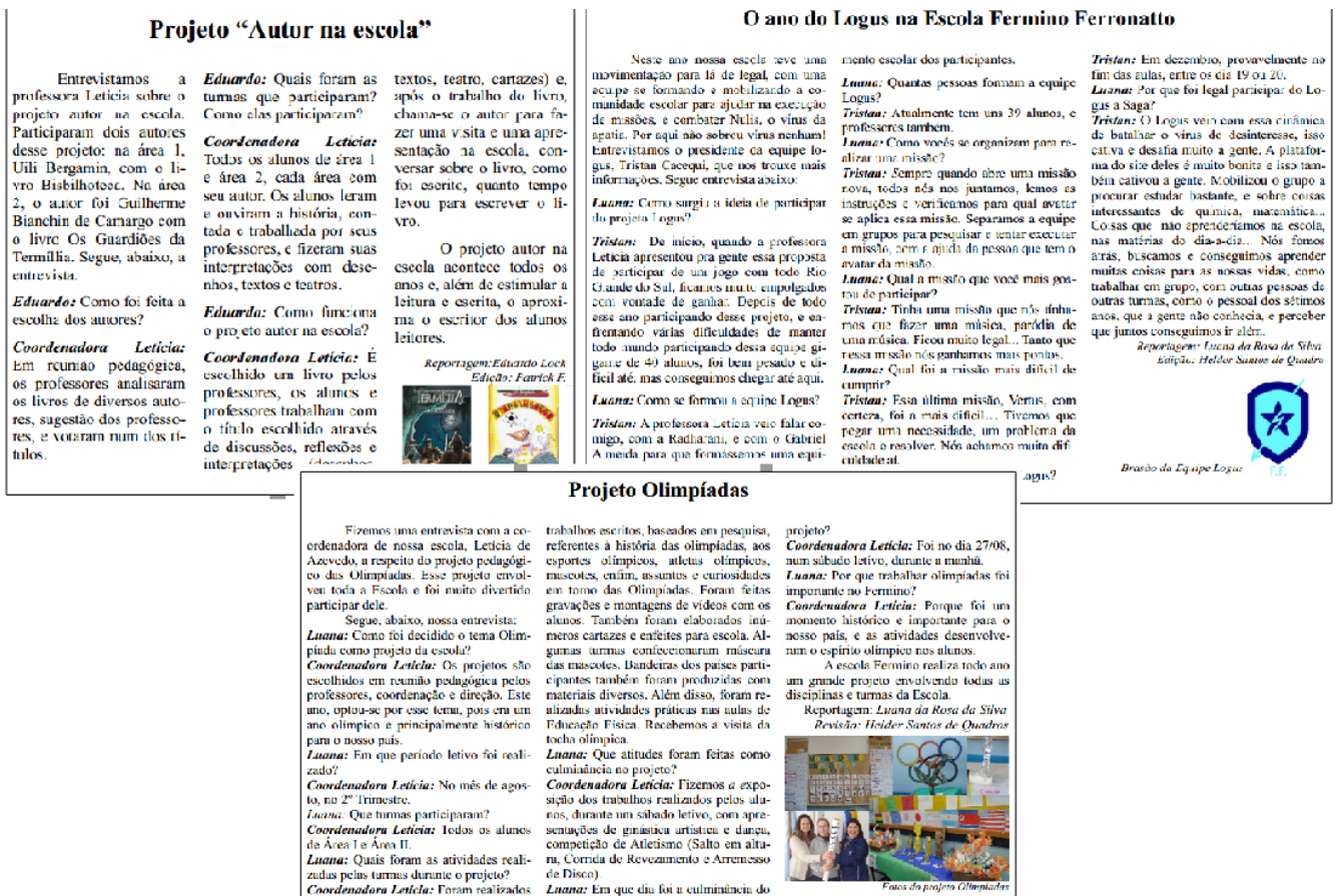
Fig. 2: Entrevistas Diagramadas.

Com as definições estabelecidas quanto sua à estrutura, juntamente com o grupo, alinhou-se uma dinâmica e identidade de jornal com características institucionais, estudantis e escolares [7]. Montou-se a equipe de redação, e dividiu-se as responsabilidades de acordo com iniciativas e interesses dos alunos, que decidiram trabalhar em duplas, para a realização das demandas. Optou-se pela redação três notícias escolares, na forma de entrevistas, sobre projetos escolares: Autor na Escola, Olimpíadas e participação da escola na Saga Logus. As pessoas entrevistadas foram a coordenadora da escola e o líder da equipe Logus (Fig. 2).