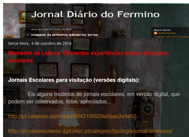
Fig. 1: Imagem do Blog.

Após a conversa inicial, criamos um blog a partir da plataforma de blogs do google, o “Jornal Diário do Fermino”. Realizou-se, em cooperação com os alunos, uma pesquisa na internet sobre jornais escolares, sua estrutura, seus formatos, maneira de diagramar, versões impressas disponíveis na internet, e também versões digitais. Muitos links com esses itens e outras curiosidades foram reunidos no Blog (Fig.1) para futura exploração de ideias, e nomeado como “momento de leitura”.