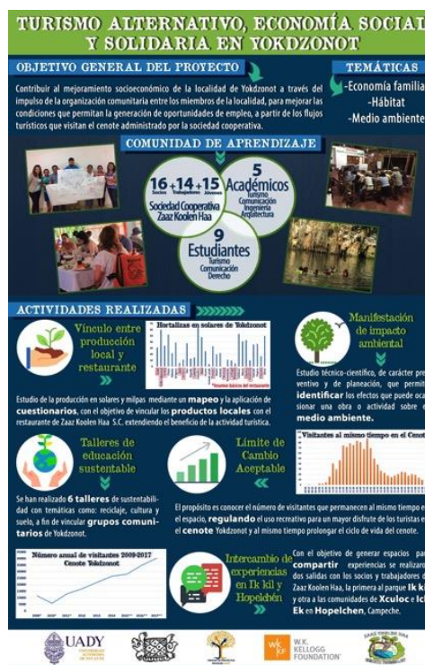
Figura 5 - Cartel de presentación del proyecto social

escenario, los estudiantes se ven inmersos en las tomas de decisiones relativas a la gestión y al desarrollo del proyecto. Por ejemplo, durante el primer año, nueve estudiantes participaron en la realización de actividades, tales como un diagnóstico acerca de la vinculación entre producción local y el restaurante turístico, talleres de educación ambiental con niños y adolescentes vinculados a la cooperativa, un estudio de límite de cambio aceptable del cenote Yokdzonot, intercambios de experiencias y visitas de cenotes alrededor de Yokdzonot (Figura 5). En el transcurso del segundo año del proyecto, se llevaron a cabo actividades culturales como la obra de títeres Guardianes de los Cenotes — la cual, ante un público de 90 niños de la localidad, buscó sensibilizarlos ante la gestión del recurso hídrico — y la décima edición del festival “Varios Barrios” que asocia a artistas muralistas y grafiteros nacionales e internacionales en un festival de tres días de duración en la localidad.