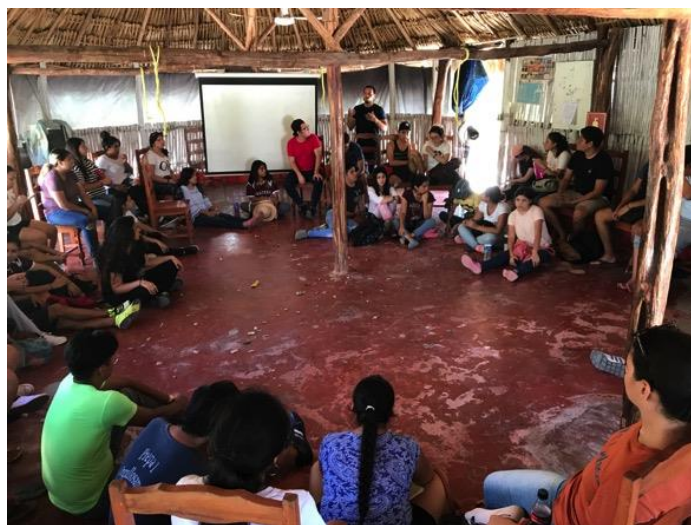
Figura 2 - Aprender fuera de la jaula de clase