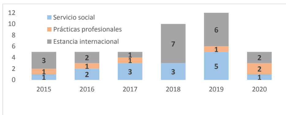
Tabla 1 - Estudiantes participantes en Co'ox Mayab entre 2015 y 2020

Por medio de Co'ox Mayab se ha logrado mejorar las habilidades administrativas y contables de algunas cooperativas mediante el registro de los visitantes al parador y asesoría técnica para la elaboración de facturas y el cumplimiento de sus obligaciones fiscales. También se han impartido talleres de educación ambiental con niños para sensibilizarlos ante las problemáticas ambientales en su entorno y guiarlos en la conservación de sus recursos naturales como los cenotes y manglares. Asimismo, se ha promovido el liderazgo en jóvenes y el empoderamiento de mujeres participantes en los proyectos turísticos, por ejemplo, a través de la capacitación de guías de naturaleza certificados por la Norma Oficial Mexicana NOM-09-TUR-2002.