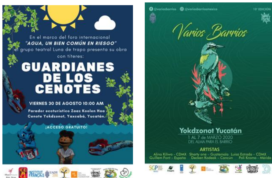
Figura 6 - Carteles de promoción la obra de títeres Guardianes de los cenotes en 2019 y del festival Varios Barrios en Yokdzonot en 2020