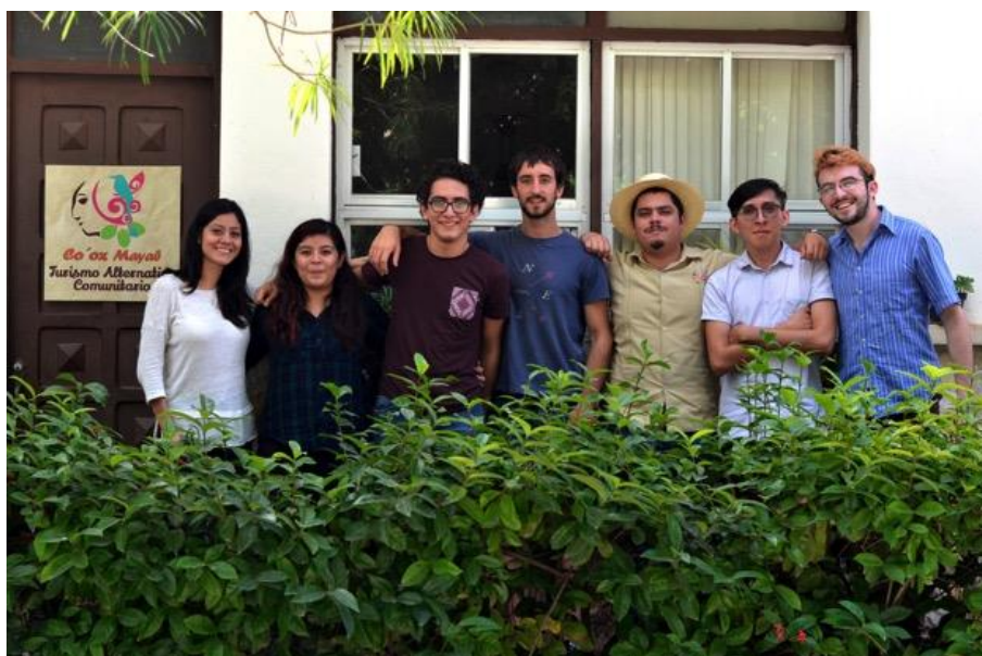
Figura 4 - Equipo operativo de Co'ox Mayab a principios de 2019

Durante su participación en Co'ox Mayab, los estudiantes adquieren capacidades prácticas vinculadas a la comercialización de servicios turísticos desde la planificación y administración de una empresa, integrando el desarrollo de productos y la promoción en medios impresos o digitales. El esquema colaborativo de Co'ox Mayab como organización de la economía social genera aprendizajes relativos a la forma de llevar a cabo asambleas, capacitaciones o eventos públicos en colaboración directa con las empresas socias de la unión. De este modo, la participación de los estudiantes no se limita al enfoque comercial del turismo, sino que integra experiencias vinculadas con la gestión organizacional de una empresa comunitaria. Hasta el día de hoy, Co'ox Mayab continúa su proceso de construcción e involucra activamente a egresados y estudiantes de la Licenciatura mediante la gestión de proyectos y becas estudiantiles.