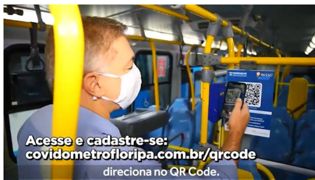
Figura 2 - Conscientização da importância do uso da Smart Tracking para os usuários do transporte público

Caso 1: retorno do transporte público na cidade de Florianópolis - O transporte público na cidade de Florianópolis foi paralisado no dia 17 de março de 2020 e somente retornou no dia 17 de junho de 2020. Entretanto, a Prefeitura Municipal de Florianópolis [PMF] adotou a ferramenta Smart Tracking como protocolo de saúde da cidade, exigindo a instalação do QR Code em toda a frota de ônibus do Consórcio Fênix, concessionária do transporte público da cidade. A PMF iniciou processo de conscientização dos usuários da importância do uso da ferramenta e como ela seria utilizada para o controle da Covid-19 na cidade. A Figura 2 mostra o Prefeito Gean Marques Loureiro fazendo o demonstrativo da ferramenta.