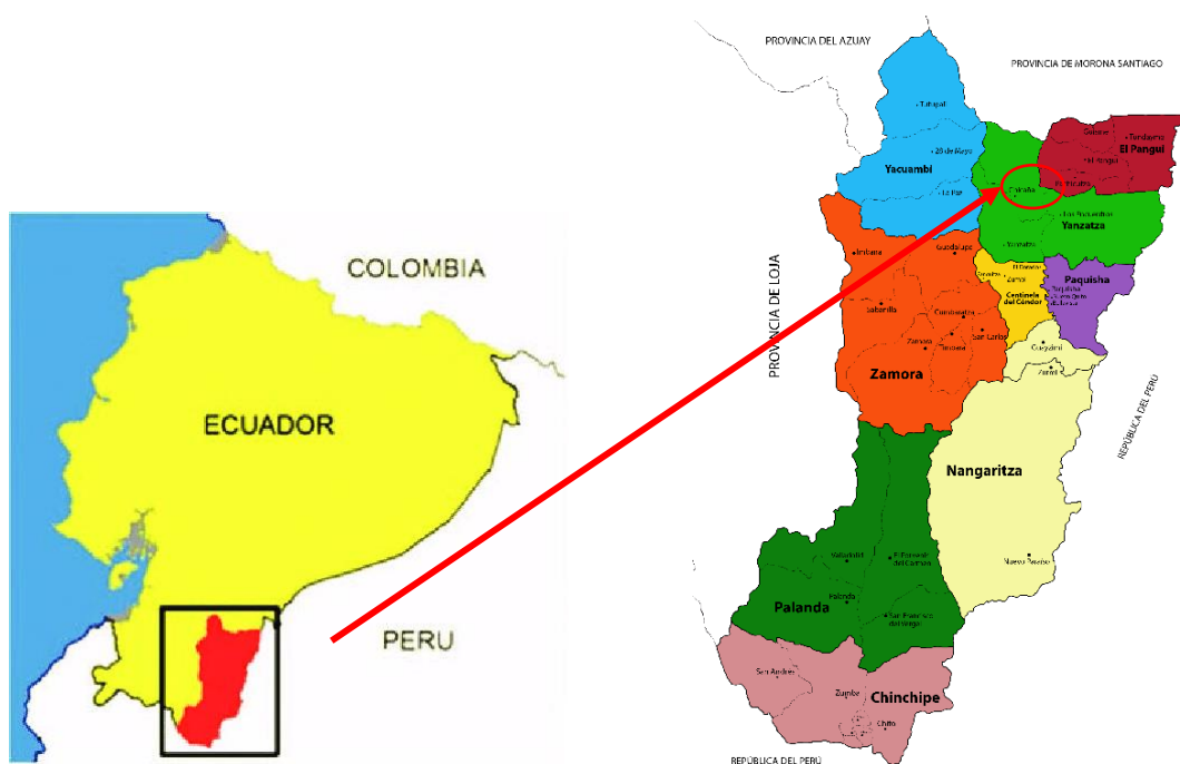
Figura 1 - Ubicación de la comunidad San Miguel de Napurak