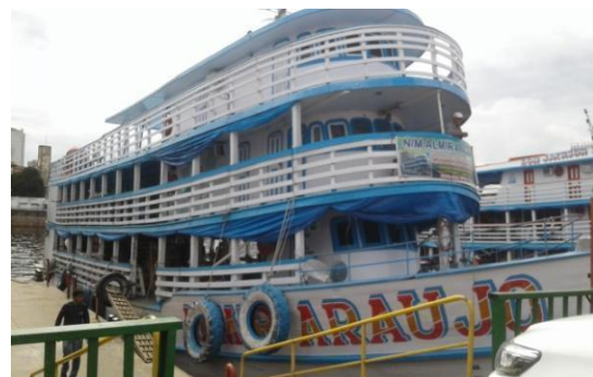
B – Navio Motor