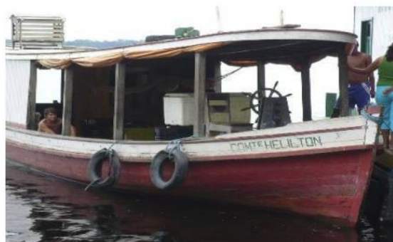
A – Barco Motor