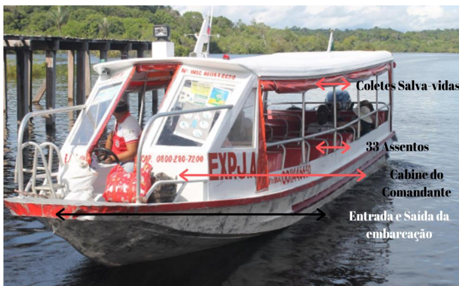
Figura 7 – Característica da embarcação Expresso Davi

Para caracterizar uma embarcação de médio porte, selecionou-se o Expresso Davi, da frota da Cooperativa ACAMDAF, na Marina do Davi. Esta embarcação de um único pavimento, na parte frontal utiliza uma escada para a saída e entrada do usuário; do lado direito, fica a cabine do comandante que se resume a um espaço com a poltrona e volante; na extensão da embarcação 33 assentos com capacidade para duas pessoas, se dividem entre os dois lados; e, no teto, ficam 35 coletes salva vidas.