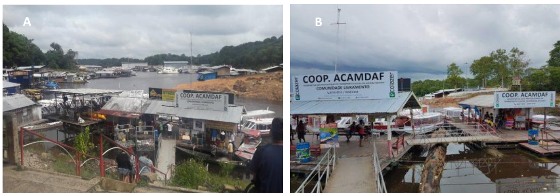
Figura 3 - Marina do Davi - Vista da escadaria (A) / Entrada da Cooperativa (B)

esquerda do rio Negro, nos limites entre a zona rural e urbana de Manaus, sendo proibida a travessia. Do ponto de vista logístico, o acesso à Marina do Davi a 1,3 quilômetros da praia da Ponta Negra, em geral, é feito a pé pelos usuários devido à ausência de transporte público urbano e, no local, principalmente no período da seca que se inicia no mês de agosto, a precária oferta de serviços e infraestrutura coloca o usuário em situação de risco para acessar as embarcações.