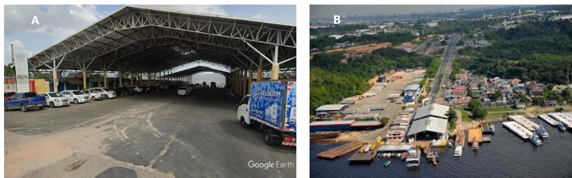
Figura 4 - Porto da Ceasa em Manaus -Vista frontal (A) / Vista aérea (B)

Fonte: (A) Google Earthl (2021); (B)Fernandesalfredoblog (2019). Link