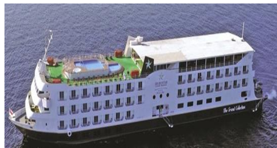
D – Navio Turismo

Fonte: (A, C, D): Pereira (2013); (B): Farias (2019)