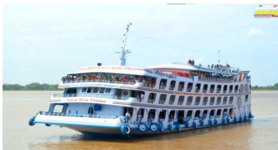
C – Ferry Boat