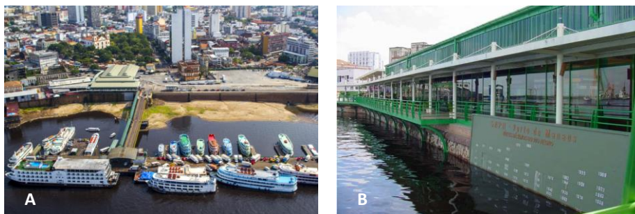
Figura 2 - Porto Roadway Manaus - Vista panorâmica (A) / Régua Fluviométrica (B)