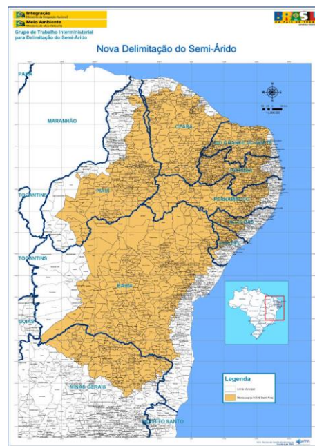
Figura 1 - Actual delimitación del Semiárido brasileño.

Estos tres criterios fueron aplicados a todos los municipios que pertenecían a la SUDENE e inclusive a municipios del norte de Minas Gerais y de Espírito Santo; el cometido era encontrar por lo menos uno de los tres criterios enumerados. Así, la nueva delimitación y caracterización, que rige actualmente, pasó a englobar un total de 1133 municipios ocupando 980.000 km 2 aprox. en un territorio que abarca el norte de Minas Gerais, Bahia, Piauí, Sergipe, Alagoas, Pernambuco, Paraíba, Rio Grande do Norte y Ceará; es decir, el Norte de Minas Gerais y parte de los estados del Nordeste con la excepción de Maranhão (ver Figura 1). De esta manera, el nuevo Semiárido brasileiro pasa a ser una de las regiones más densamente pobladas concentrando 31,6 millones de personas, lo que consistiría en el decir el 19% de la población del país (Moreira Neto, 2013).