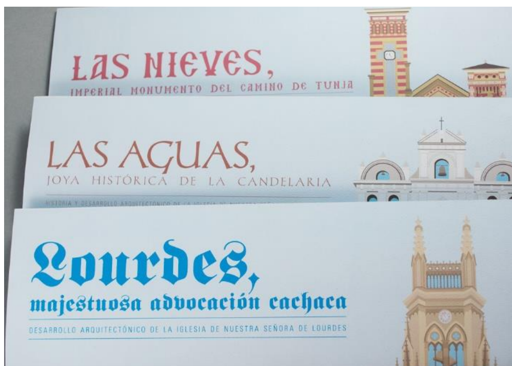
Figura 1 – Turismo Arquitetônico em Bogotá brochura promocional.

Fonte: Design: Cárdenas & Lora (2015), disponível em https://www.behance.net .