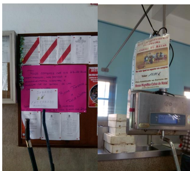
Figura 5 e 6 – Cartazes no interior do Mercado de Silves.

Um plano de comunicação que envolva ativamente o design de comunicação no mercado apresenta-se adequado para o relacionamento deste espaço com o exterior. A maneira como se comunica e o que se comunica sobre o Mercado Municipal de Silves atualmente é precário e inconsistente.