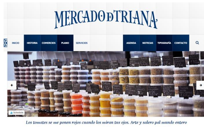
Figura 7 – Página de Internet do Mercado de Triana