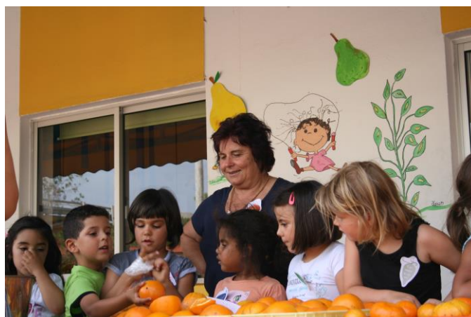
Figura 8 – Evento da Semente à Banca do projeto Consumir Local

A experiência piloto foi desenvolvida num pré-escolar com crianças entre os quatro e cinco anos de idade, em que se criou peças gráficas para um evento denominado Da Semente à Banca (fig.8), realizado em junho de 2015, levando produtores e comerciantes do Mercado Municipal de Silves à instituição Amigos dos Pequenininhos de Silves. Sensibilizando crianças, pais, técnicos educativos e produtores devolvendo à comunidade o valor do projeto. Esta ação de sensibilização à existência de produtores agrícolas locais visionou alertar o público, famílias [crianças e respetivos educadores] da qualidade dos produtos locais. Este minimercado hortícola em que as crianças fizeram de vendedores de produtos frescos, colaborando diretamente com os produtores; contou com jogos sobre a produção e sensibilização do consumo local desenvolvidos especificamente para o local. Foi desenvolvida uma estratégia comunicacional em redor do conceito ‘consumir local’. A comunicação do evento e o evento possuíam imagem gráfica dedicada e transmitiam visual e textualmente valores associados à produção e consumo local. O design de comunicação agiu aqui como catalisador social. O envolvimento do público foi positivo na medida em que todos que participaram no projeto envolveram-se ativamente, numa dinâmica intergeracional, possibilitando novos públicos aos produtores e estimulando a troca e partilha social.