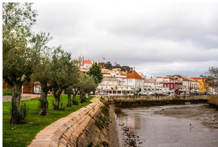
Figura 4 – Mercado Municipal de Silves na atualidade.

A intervenção no mercado municipal de Silves apresenta-se-nos como pertinente. Grande parte dos espaços do mercado estão atualmente abandonados por falta de comerciantes que os ocupem, o interior sofre de falta de iluminação, um estacionamento frente ao edifício e os toldos de lona dos restaurantes do exterior interferem com a estética do edifício, bloqueando a visibilidade deste. Melhoramentos têm sido elaborados pelas entidades responsáveis pelo edifício, sobretudo a nível estrutural do mesmo, como painéis informativos e irão iniciar-se obras ao telhado.