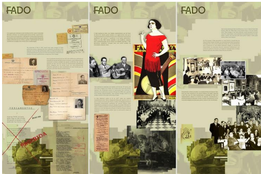
Figura 2 – Painel da Exposição Itinerante de Candidatura do Fado à Lista Representativa do Património Cultural Imaterial da Humanidade (Unesco).

Fonte: Design: Vilarinho, 2011, disponível em https://www.behance.net .