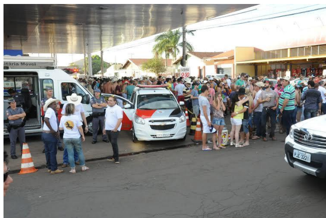
Figura 2 – Avenida 43 durante a realização da Festa do Peão de Barretos 2015