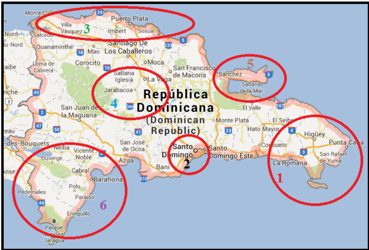
Figura 1. Mapa polos turísticos de República Dominicana.