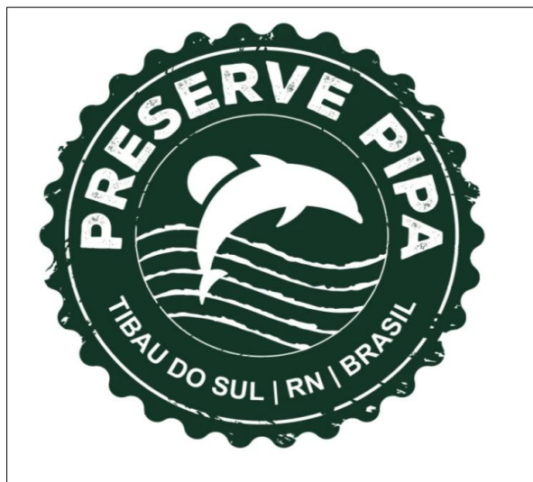
Figura 4. Logo do Movimento Preserve Pipa

É nesse cenário diverso e múltiplo que se insere o Movimento Preserve Pipa que é uma iniciativa dos membros da Associação de Hoteleiros de Tibau do Sul e Pipa (ASHTEP) e do Pipa Convention & Visitors Bureau que foi fundada no ano de 2017 e tem como objetivo proporcionar uma relação harmoniosa entre a natureza e as empresas locais, garantindo o bem-estar dos moradores e proporcionando uma boa experiência aos turistas que visitam a cidade e o vilarejo (Preserve Pipa, 2023) (Figura 4). O projeto conta com a participação de aproximadamente 50 hoteleiros e 80 empreendimentos locais (entre bares, restaurantes e agências de passeios).