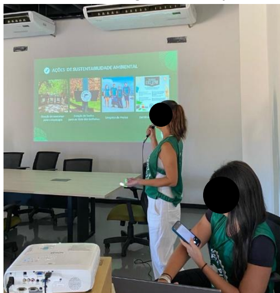
Figura 5. Palestra com os integrantes do Projeto Preserva Pipa

Por fim, realizou-se observação participante em alguns empreendimentos associados e participação de palestra com integrantes do Projeto Preserva Pipa, como exposto na figura 5. Essa etapa de campo foi realizada nos dias 25 e 26 de outubro, durante visita técnica realizada pelos pesquisadores. Essa atividade foi proposta pelo Encontro de Turismo Responsável, realizada pela Universidade Federal do Rio Grande do Norte (UFRN), em parceria com o Ministério do Turismo em Natal – RN.