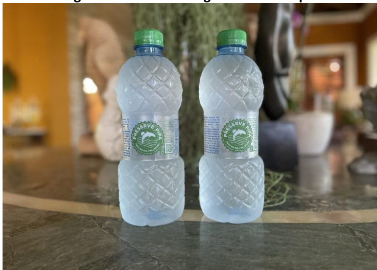
Figura 6. “Garrafa de água Preserve Pipa”