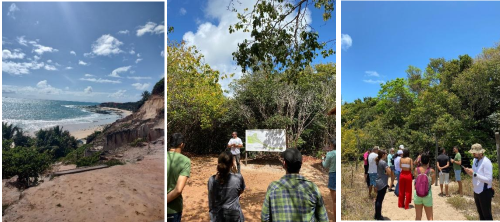
Figura 2. Atrativos naturais de Pipa-RN