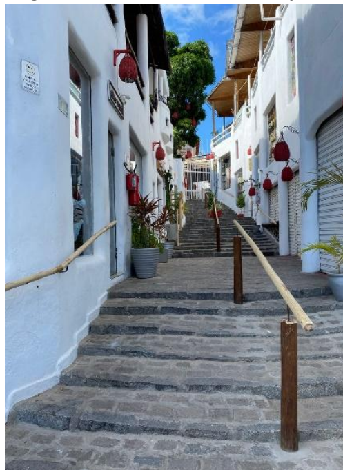
Figura 3. Atrativos naturais de Pipa-RN