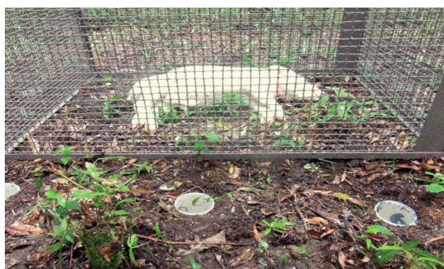
Figura 1. Experimento com Sus scrofa utilizando gaiola de proteção e armadilhas de solo ( pitfall ) na cidade de Caxias do Sul – Rio Grande do Sul, Brasil.

comercialmente). A carcaça foi disposta em decúbito lateral sob caixa de malha metálica (1,5 cm 2 ) com dimensões 100x70x60 cm 3 com a finalidade de evitar a interferência de vertebrados (carnívoros e necrófagos) e permitir o acesso da entomofauna. No entorno da caixa foram instaladas 10 armadilhas de solo do tipo pitfall (copos plásticos de 300 ml) contendo água e uma gota de detergente, a fim de quebrar a tensão superficial, para a coleta dos invertebrados. O conteúdo das armadilhas foi substituído diariamente após as coletas. As armadilhas ficaram 10 cm distantes da caixa e equidistantes entre si (Figura 1).