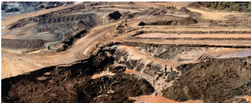
Figura 1 – Vista aérea do local após o deslizamento de terra