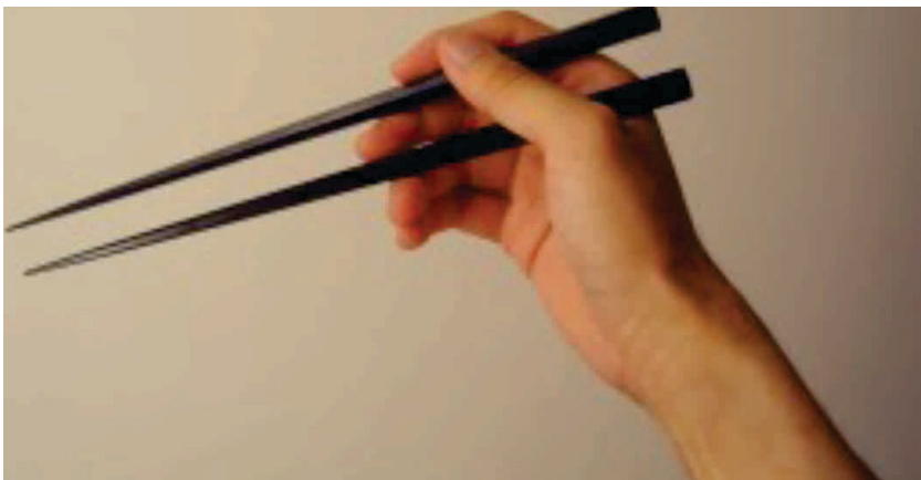
Imagem 1 – Palito japonês para pegar o alimento ( hashi )