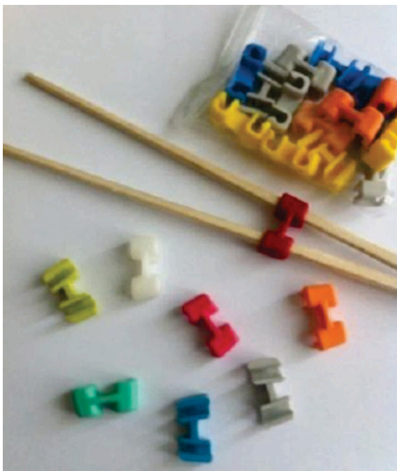
Imagem 2 – Adaptador utilizado no palito japonês