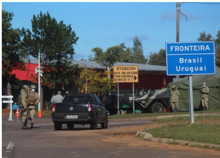
Figura 4 – Fechamento e militarização da fronteira entre Uruguai e Brasil

Fonte: Marcelo Pinto/A Plateia/CNN Brasil. Disponível em: https://www.cnnbrasil.com.br/internacional/uruguai-controla-covid-19-com-liberdades-impensaveis-em-outros-paises/ . Acesso em: 25 set. 2024.