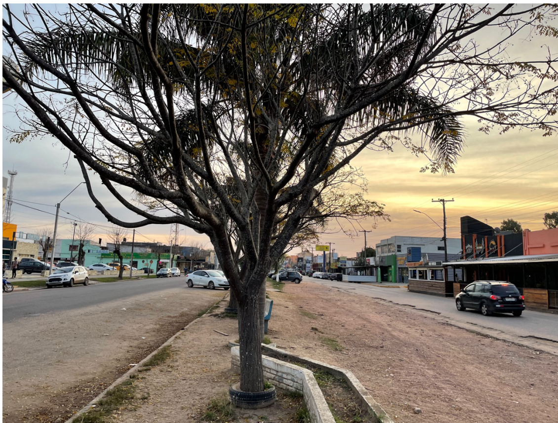
Figura 3 – Limite internacional Uruguai-Brasil (Chuy-Chuí)

não podiam cruzar a fronteira, sob pena de multa. Foi tudo muito difícil. (Autoridade A). 4