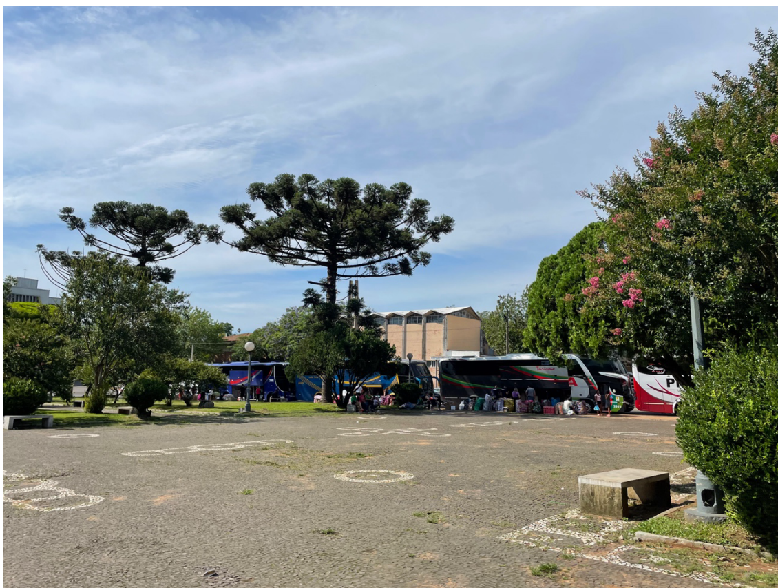
Figura 2 – Ônibus com clientes brasileiros junto à Praça Internacional entre Santana do Livramento-Rivera

os que atuavam na informalidade, não puderam mais atravessar para realizar suas atividades laborais. O impacto foi especialmente sentido em setores como o comércio de mercadorias e os serviços de transporte. A Figura 2 ilustra as áreas de maior dependência do fluxo transfronteiriço como no caso da fronteira Brasil-Uruguai, nas cidades de Santana do Livramento e Rivera, com pujante atividade comercial e turística.